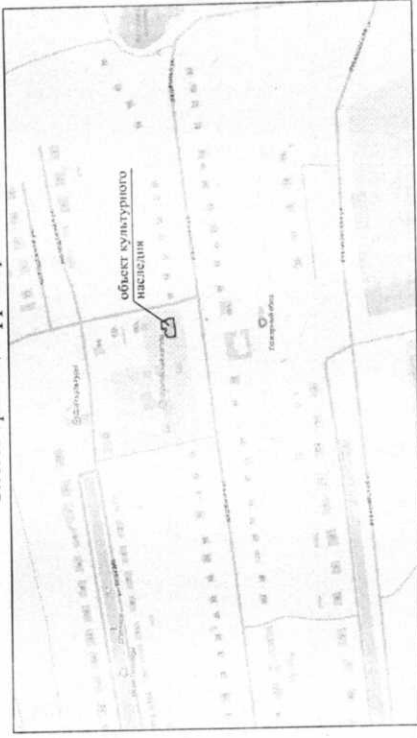
Схема границ территории

Границы территории объекта культурного наследия местного (муниципального) значения, включенный в единый государственный реестр объектов культурного наследия (памятников истории и культуры) народов Российской Федерации, расположенного на территории муниципального образования «Тимирязевское сельское поселение», Здание земской мужской школы, 1915 г., по адресу: Ульяновская область, Ульяновский район, с.Шумовка, ул.Школьная, 50