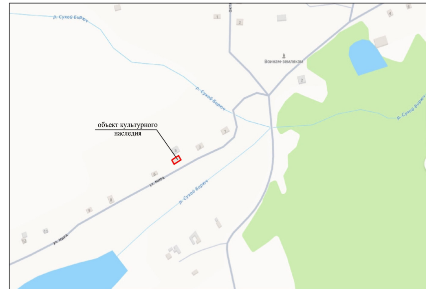
Схема границ территории